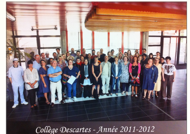
Collège Descartes - Année 2011-2012

Médiatrice en milieu scolaire, elle intervient sur la prévention des violences, des risques et des décrochages scolaires. Elle sensibilise et valorise l'expression culturelle, sportive et citoyenne au sein du collège.